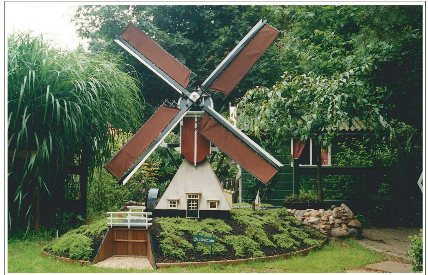
Wipwatermolen gemaakt door Pleun.